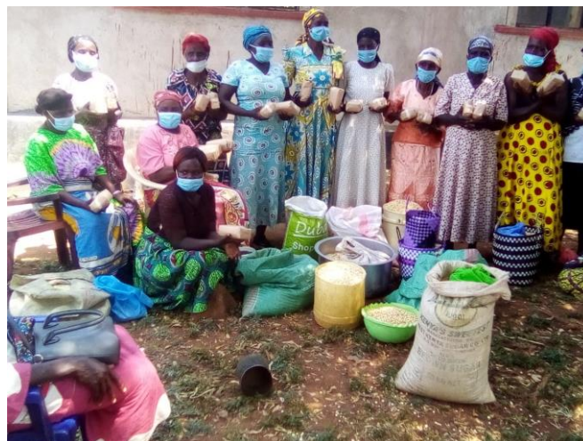
Mais, bonen en suiker