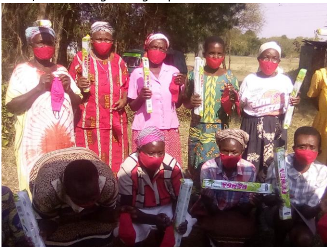
Mondkapjes en zeep